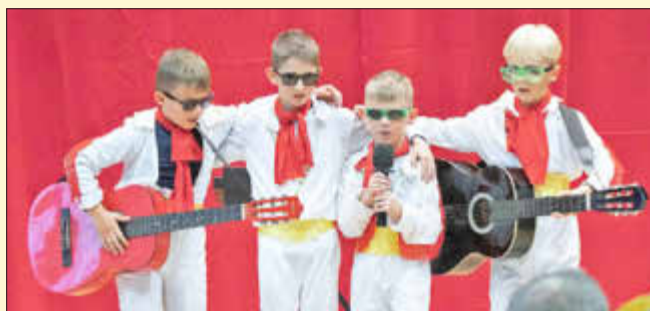
Nachwuchskicker des SV Güllesheim als Band mit dem Titel: „Marmor, Stein und Eisen bricht“.