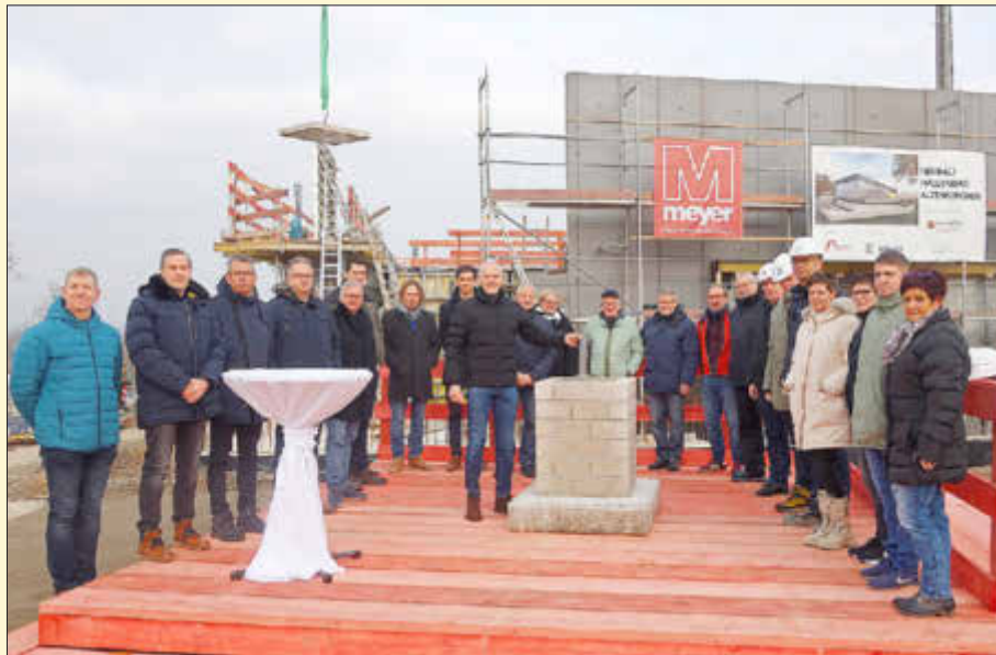
Im Beisein von Vertretern aus Politik, der Verwaltung sowie der beauftragten Planungs- und Baufirmen fand die symbolische Grundsteinlegung des künftigen Hallenbades statt.

Nach derzeitigem Stand belaufen sich die Kosten auf 18,6 Millionen Euro.