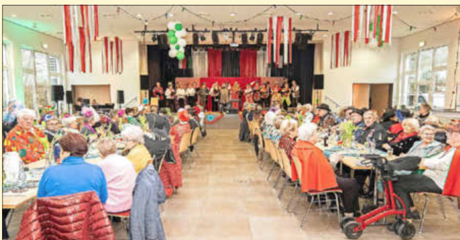
Blick in den Saal. Auf der Bühne der MGV Horhausen