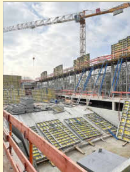
Die Rohbauarbeiten am Kellergeschoss sind mittlerweile abgeschlossen.