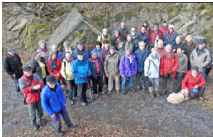
Die Wandergruppe am Eingang des Schieferbergwerks „Assberg“

Mehr als vierzig Wanderinnen und Wanderer fanden sich bei strahlendem Sonnenschein, aber kaltem Wind, am Ausgangspunkt in Astart ein. Von hier aus führte der Weg in Richtung Marienstatt, um nach wenigen Hundert Metern die Nister zu überqueren. Vor das Schieferbergwerk „Assberg“ haben die Götter den Schweiß gesetzt, denn der Wandersteig verwandelt sich urplötzlich in einen Treppenzug. Der überwindet gut 80 Meter Höhenunterschied bis zum Eingang des Bergwerks. Es ist die älteste und größte Dachschiefergrube des Westerwaldes. Nach gemächlichem Aufstieg und einer längeren Pause konnte die Wanderung nach Limbach fortgesetzt werden. Auf dem Assberg genossen alle die herrliche Aussicht über Limbach und das Nistertal hinweg. Sogar der neu aufgestellte Förderturm in Malberg war deutlich sichtbar. Die Wanderschar lenkte ihre Schritte bergab nach Limbach.